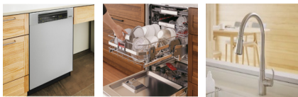
Miele食器洗い機 AEG食器洗い機 Kohlerタッチレス水栓

その他の登録されているリフォームの対象製品は、子どもエコすまい支援事業の公式サイトから検索いただけます。