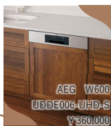
AEG W600 UDDE006-UHD-S ¥360,000