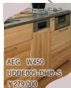
AEG W450 UDDE005-DHD-S ¥279,000