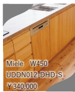
Miele W450 UDDN012-DHD-S ¥340,000 ステンレス扉も対応