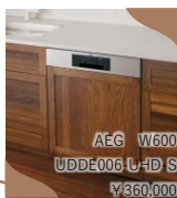
AEG W600 UDDE006 UHD S ¥360,000