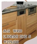
AEG W450 UDDE005 DHD S ¥279,000