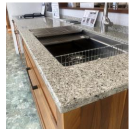
プラザさいたまの展示品 フィオレストーン (R2)

約93%が天然の水晶で硬度が高く傷つきにくいエンジニアドストーンのワークトップ 天然石と比べ微細な穴が少ないので汚れが入り込まず細菌が発生しにくく衛生的です。 天然石の風合いを持ちながら、自然素材の欠点を克服しており、 意匠性も、機能性もすぐれた天板です。 無垢の扉との相性もバッチリなので、お好みの組み合わせを見つけてみてください◎ プラザさいたまではフィオレストーンを使用したキッチンの展示をしております。 ぜひショールームにて実物をご確認ください！