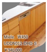
Miele W450 UDDN012 DHD S ¥340,000