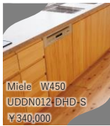
ステンレス扉も対応