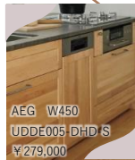
ステンレス扉も対応