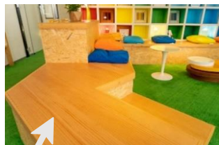
うづくりの床材でつくられたベンチ

【木十彩 -KITOIRO-】の壁に囲まれた「ドリームポニー」のオフィス。教育系アプリをつくるスタートアップ企業にぴったりな、自由な発想が生まれそうな空間が広がっています。