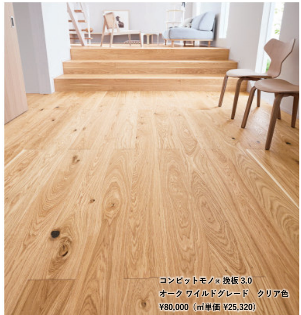
コンビットモノ® 挽板 3.0 オーク ワイルドグレード クリア色 ¥80,000 (㎡単価 ¥25,320)