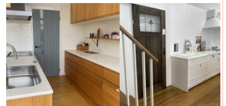
エナメル調ウレタン仕上げ (D8ブルー) | 自然塗料仕上げ (自然塗料ブラック)