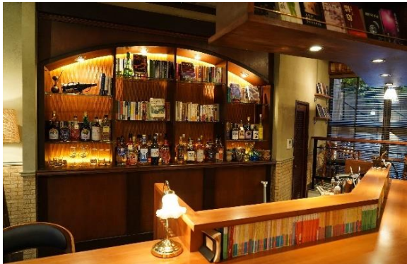
無垢の木の壁材「デザインウォール 菱」が設置されたドラマセット