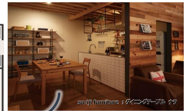
su:iji furniture：ダイニングテーブル ナラ