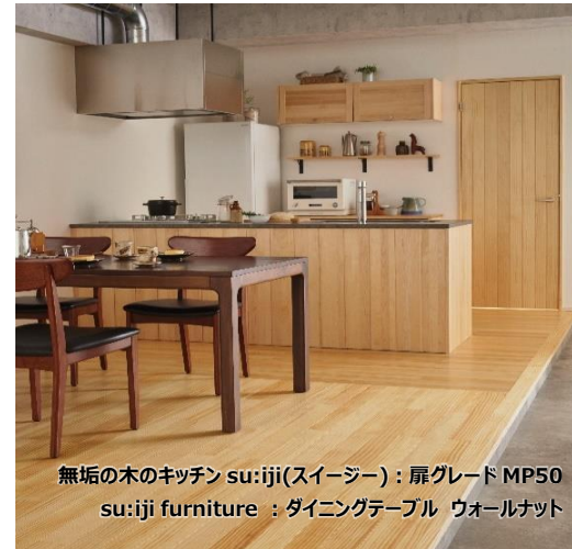
無垢の木のキッチン su:iji(スージー)：扉グレード MP50 su:iji furniture：ダイニングテーブル ウォールナット