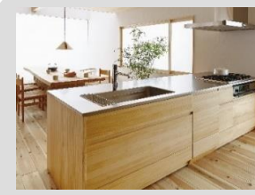
無垢の木のキッチン su:iji(スージー)：扉グレード NZ20/ナチュラル色

配置はそのままにキッチン形状を変更！ キッチンを変えると、集中しやすい配置はそのままに、フルフラットでお皿の受け渡ししやすいキッチンに！