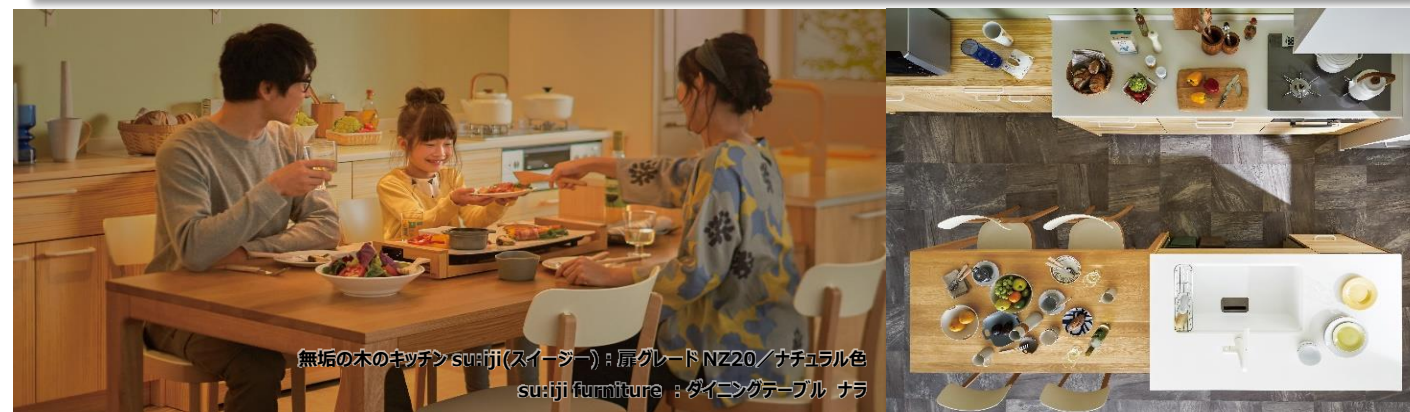
無垢の木のキッチン su:iji(スージー)：扉グレード NZ20/ナチュラル色 su:iji furniture：ダイニングテーブル ナラ