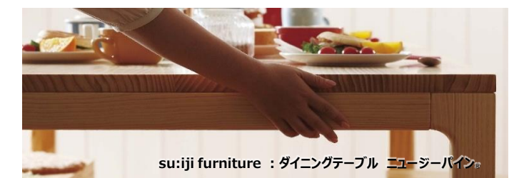
su:iji furniture：ダイニングテーブル ニュージーバイン