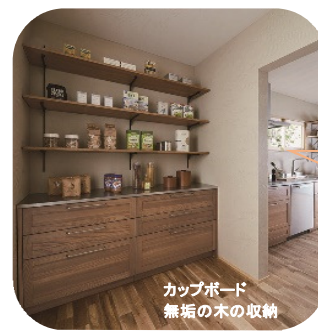
カップボード 無垢の木の収納

前に壁があるおかげで、よく使うコーヒーセットやキッチンツールは、棚に見えながら収納。サッと取れてインテリアにもなる、カフェみたいな雰囲気イメージ。