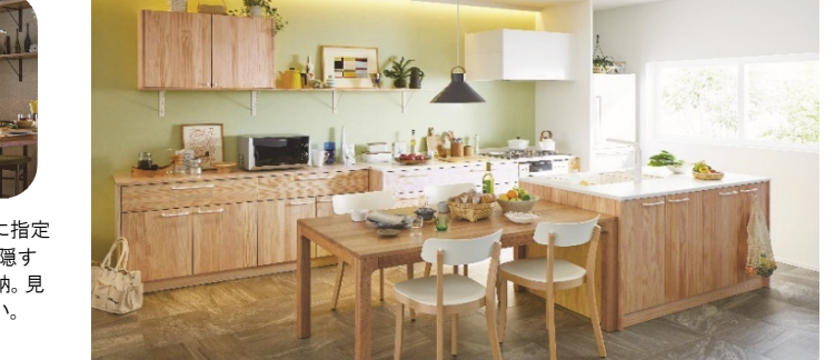
II型キッチン シンク側間口1545mm×奥行900mm 加熱側間口2125mm×奥行650mm (NZ20/ナチュラル色) スージーカタログP53~

キッチンとテーブルを横並びにすることで、「お隣の席に座っているような距離感」にも。甘えんぼのお子様にも、いつでも目と声が届くので安心してテーブルで絵本を読んだり歌を歌ったりしてとても楽しそう。