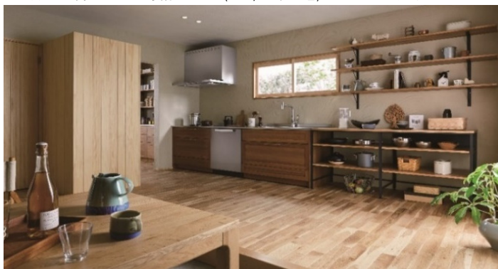
I型キッチン 間口2575mm×奥行650mm (OK50/ミディアム色) スージーカタログP37~

窓のある面にキッチンがあれば明るく風通しもgood。晴れた日や雨の日、雪の日と季節を感じながらのびのびとごはんの支度ができるのも魅力的。