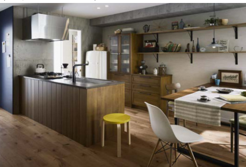
P型キッチン 間口2275mm×奥行750mm (NZ30/ミディアムブラウン色) スージーカタログP61~

対面式のキッチンですが、テーブルとの間にほどよい距離間があるため、ダイニングでの団らん時間に落ち着きが生まれます。間口が狭くてもテーブルの位置を工夫することにより対面キッチンも使いやすく空間を広く使えます。