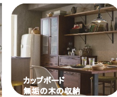
カップボード 無垢の木の収納

毎日使うキッチンモノに指定席を決めて見せるモノと隠すモノを分けてすっきり収納。見える場所こそこだわりたい。