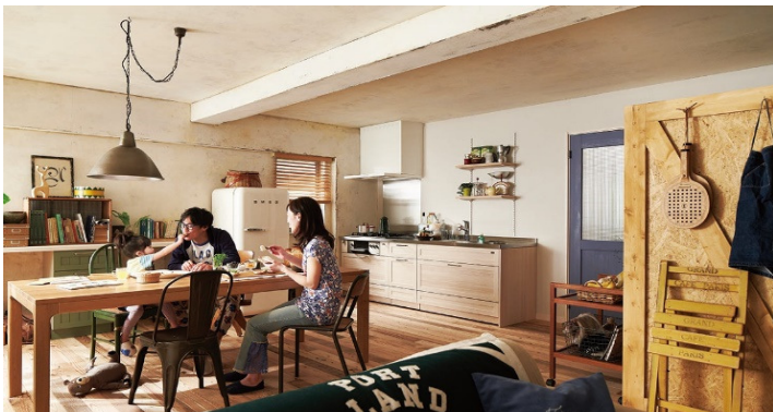
I型キッチン 間口2425mm×奥行650mm (NZ30/アイボリー色) スージーカタログP73

ダイニングテーブルを家の中心にして、つながりのあるキッチンを目指すとお料理の合間に少し顔を傾けたり、背中越しでもお話に参加しやすい。テーブルの配置が楽しい壁付けキッチンを作る秘訣です！