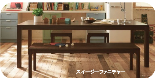
スージーファニチャー

窓のある面にキッチンがあれば明るく風通しもgood。晴れた日や雨の日、雪の日と季節を感じながらのびのびとごはんの支度ができるのも魅力的。