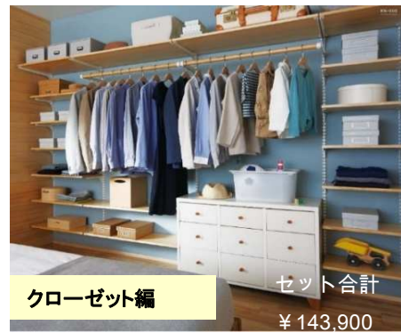
クローゼット編 セット合計 ¥143,900

悩みがちな毎日の服装のコーディネートも、何がどこにあるかわかりやすく収納したら時短に。忘れ物が無いかチェックして出発。