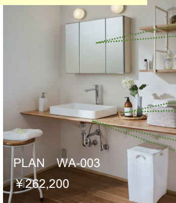
PLAN WA-003 ¥262,200