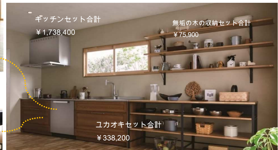
キッチンセット合計 ¥1,738,400

<ミーレ>食器洗い機 G6762SCViWO 本体定価 ¥405,000 ステンレス扉定価 ¥50,000