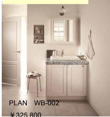
PLAN WB-002 ¥325,800

かわいい美濃焼のタイル。縁のタイルはカーブになっているからぶつかっても剥がれにくくて安心。