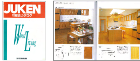
←1993年住建産業カタログ

※住建産業は2002年1月に社名変更しウッドワンになりました。この社名には「木(WOOD)と人(ONE)の共生」、「品質No.1、業界No.1」という想いを込めています。