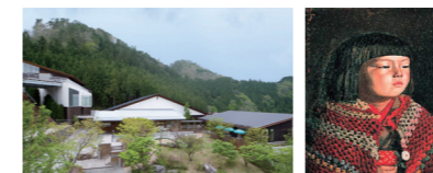
岸田劉生 「毛糸肩掛せる麗子肖像」

当社が所有する美術品約800点を展示・公開する美術館として1996年、本社のある広島県廿日市市に開館しました。ゴッホや岸田劉生はじめ素晴らしい美術品を所蔵し、ウッドワンの文化発信基地として地域貢献に努めています。