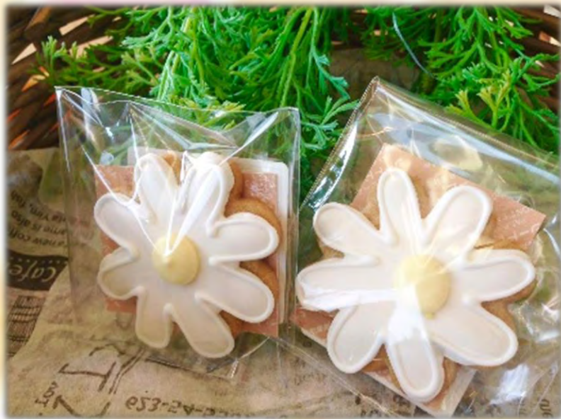
※写真はイメージ画像です。実際の物とは異なります。